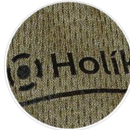
3vrstvý laminát EffiSHELL