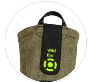
Manžeta Long a nehořlavý taháček